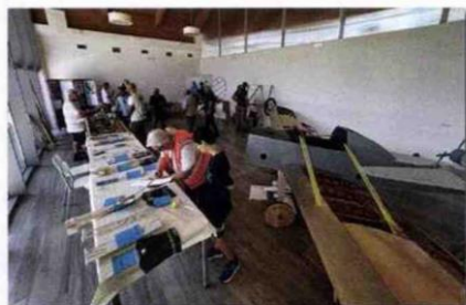
Un momento del passato Raduno Nazionale del CAP a Foligno.

da questo mese entrano nel vivo le nostre attività sociali ed è un piacere annunciare che il 51° Raduno Nazionale sarà svolto presso l'aeroporto di Reggio Emilia, dove già festeggiamo il 40° con una festa rimasta tra i più bei ricordi dell'Associazione. Il CAP parteciperà da protagonista al "Volare Airshow" nei giorni 15, 16 e 17 settembre, un evento pensato per divulgare la cultura aeronautica in tutte le sue forme, e seppure si tratti di una vera manifestazione, con tanto di performer e direttore, sarà possibile a tutti raggiungere LIDÉ anche in volo e, fatti salvi gli orari delle esibizioni, cioè un paio d'ore nel primo pomeriggio del sabato e della domenica, sarà sempre possibile arrivare e ripartire. Definiremo quanto prima il programma degli eventi riservati ai soci e agli appassionati e di quelli aperti al pubblico. Senza rinunciare alla nostra cena sociale, all'assegnazione di trofei e premi e a tutto ciò che caratterizza il nostro raduno, potremo però anche partecipare agli eventi, agli spettacoli e alle tante attività che l'organizzazione sta predisponendo.